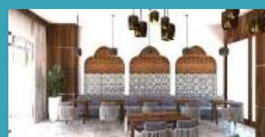
Turski A la Carte Restoran