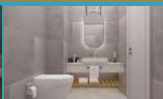
1+1 Porodična soba sa pogledom na baštu