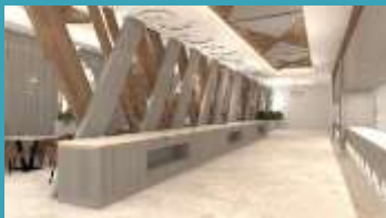
Moon glavni restoran