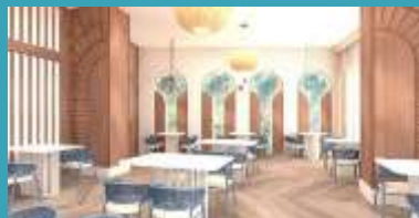
Riblji A la Carte Restoran